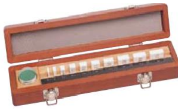
セラミックス製 BM3-10M 10個組